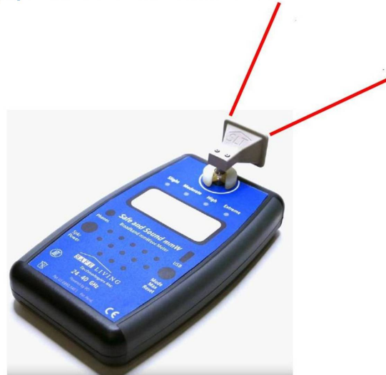
Κεραία τύπου "Horn" - Κατευθυντική (κάλυψη 35 μοίρες μπροστά)